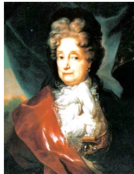
Kurfürstin Sophie von Hannover (1630-1714)